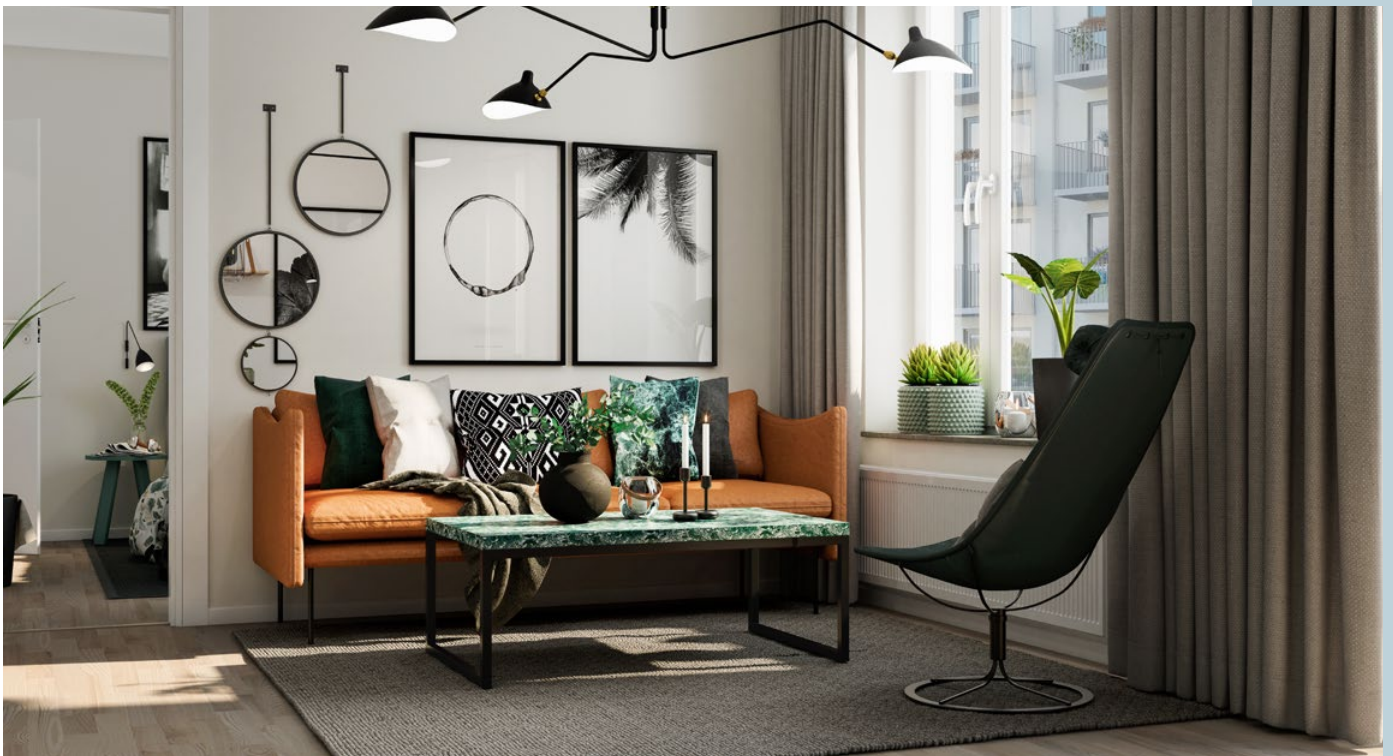
Vardagsrum knyts ihop med luftiga, sociala ytor.