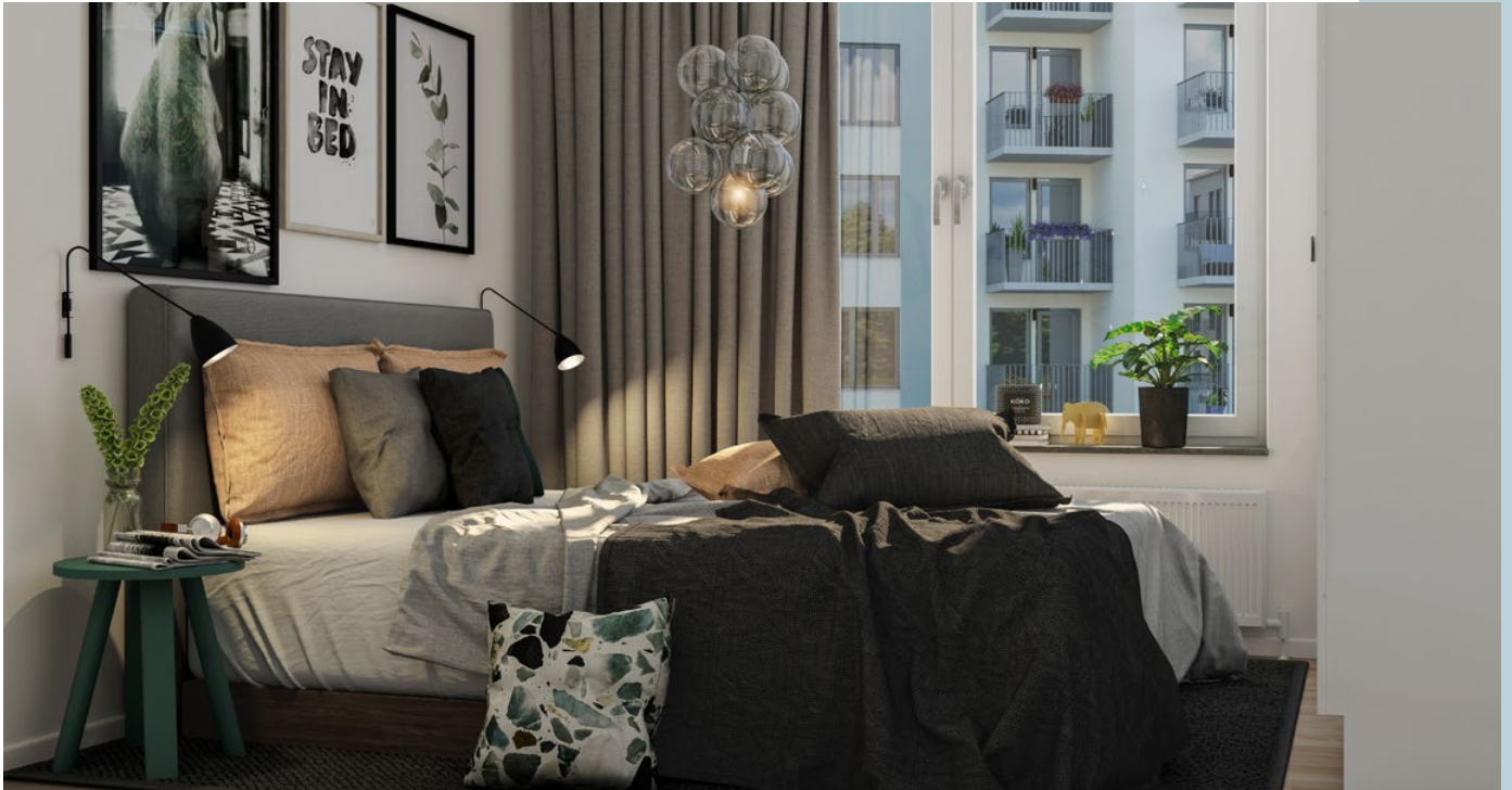
Plats för lugn och ro.